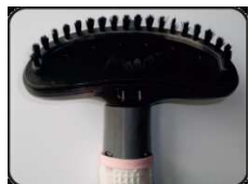
Насадка-щетка для отпаривания одежды, полотенца, постельного белья