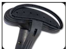
Зажим для отпаривания стрелок на брюках