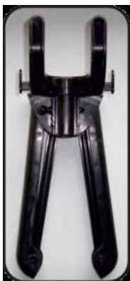
Складная вешалка с 2 зажимами