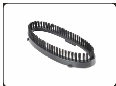
Насадка-щетка для отпаривания одежды, полотенец, постельного белья